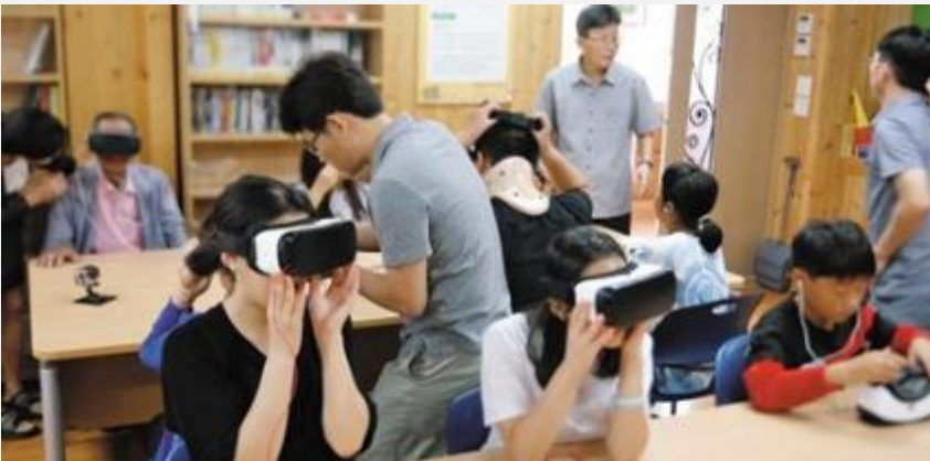
VR을 통한 교육 참고 이미지