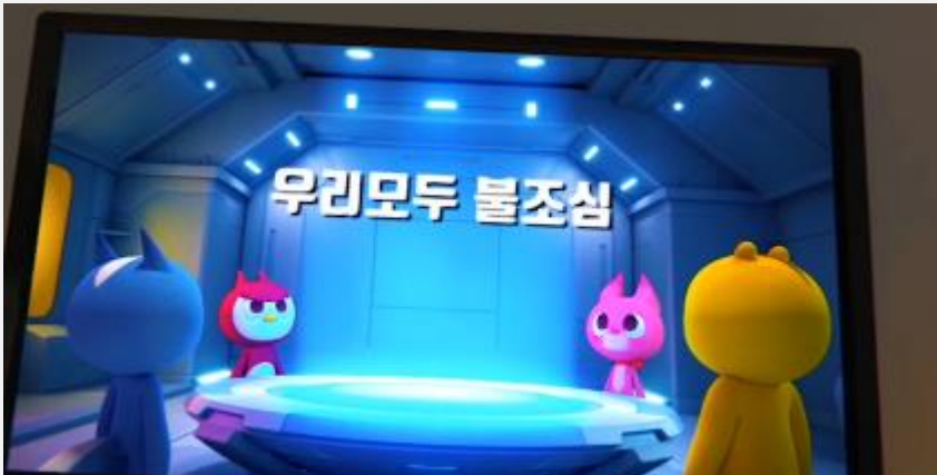
인트로 플레이 이미지