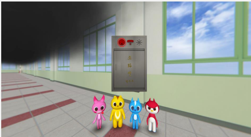
소화전 누르기 이미지