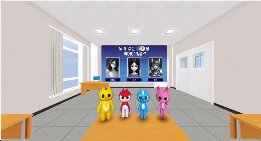
사람 선택 이미지