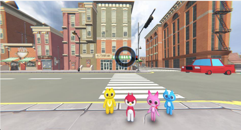
초록불 기다리기 이미지