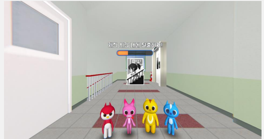
대피방법 선택 이미지