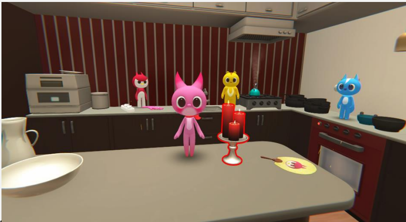
촛불 끄기 이미지