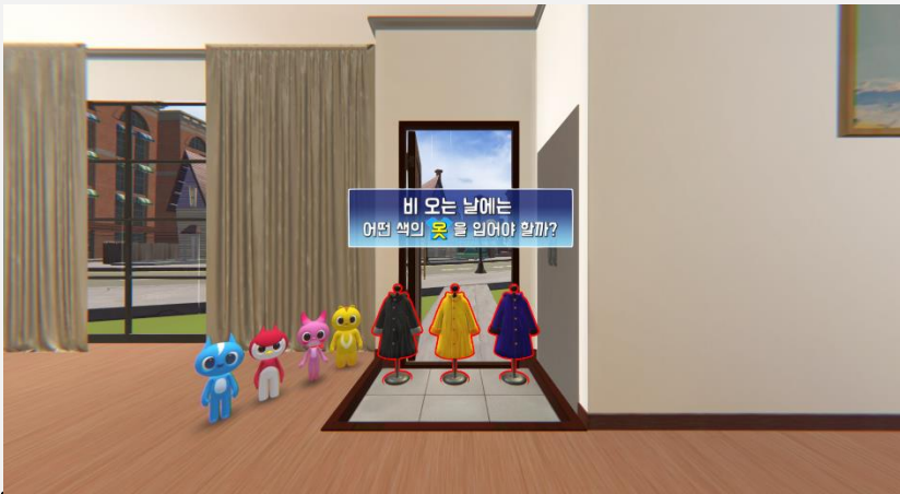
비옷 고르기 이미지