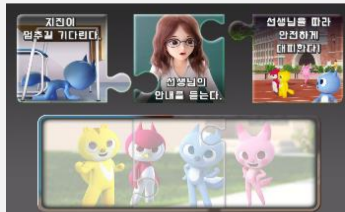
퍼즐 맞추기 플레이 이미지