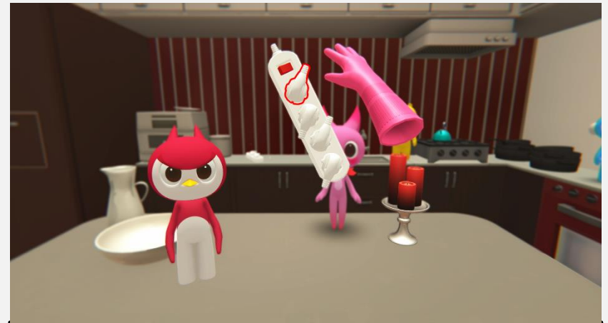
멀티탭 뽑기 이미지