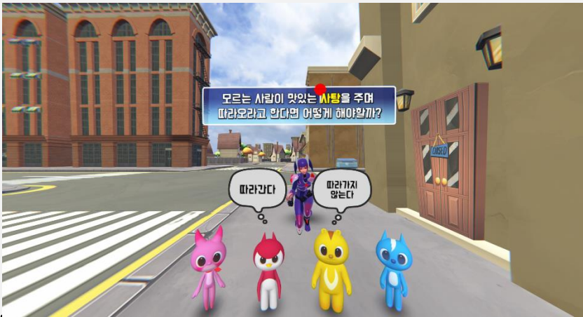
사탕 거절 이미지