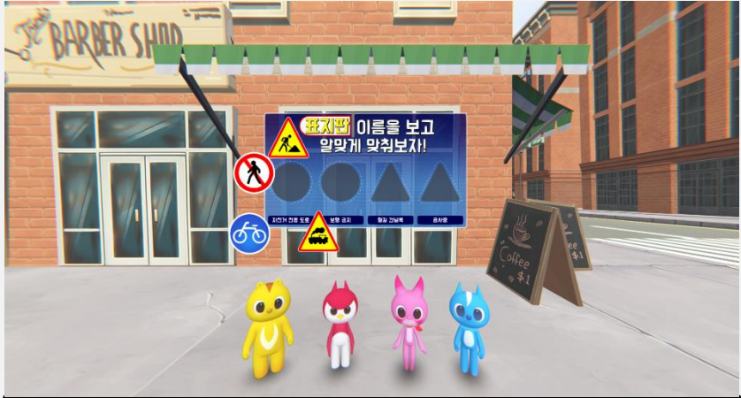
표지판 선택 이미지