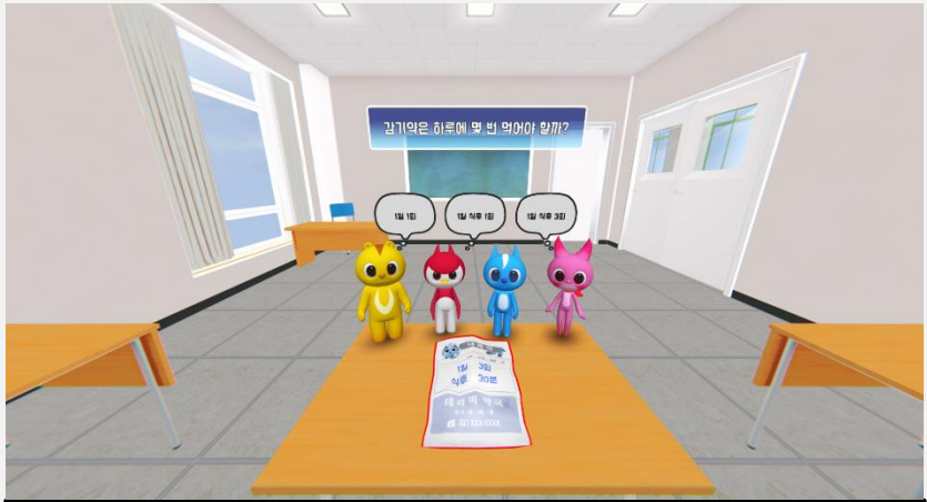
횟수 선택 이미지