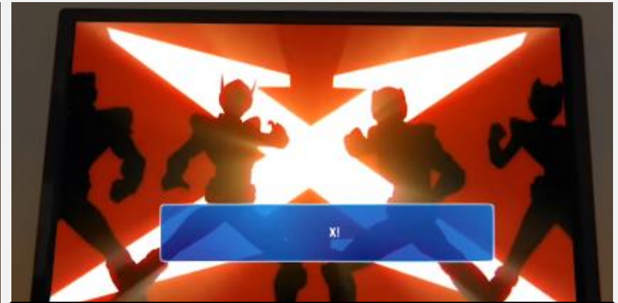
아웃트로 플레이 이미지