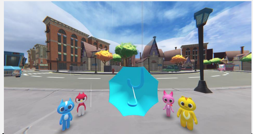
우산 들기 이미지