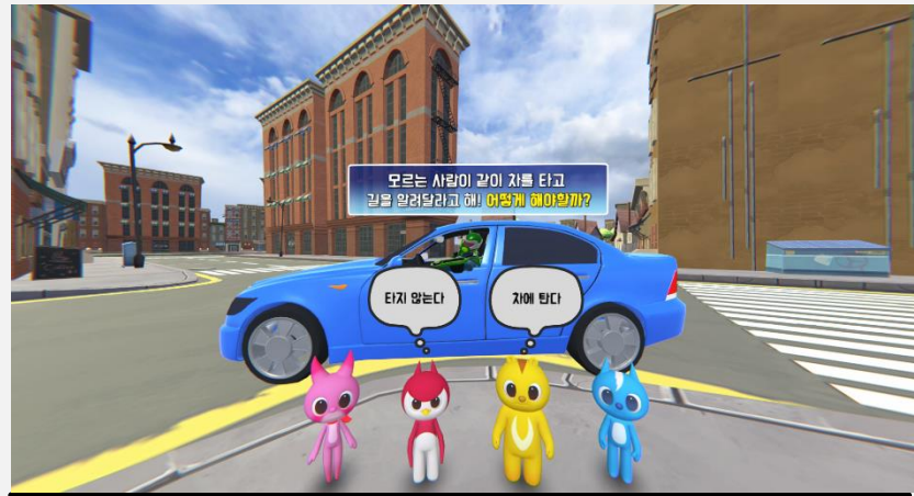
차 타기 거절 이미지