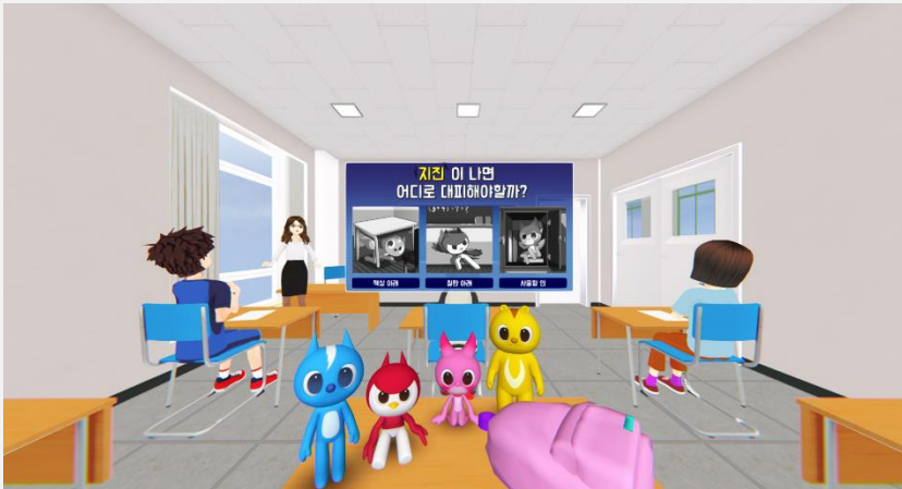
대피장소 선택 이미지