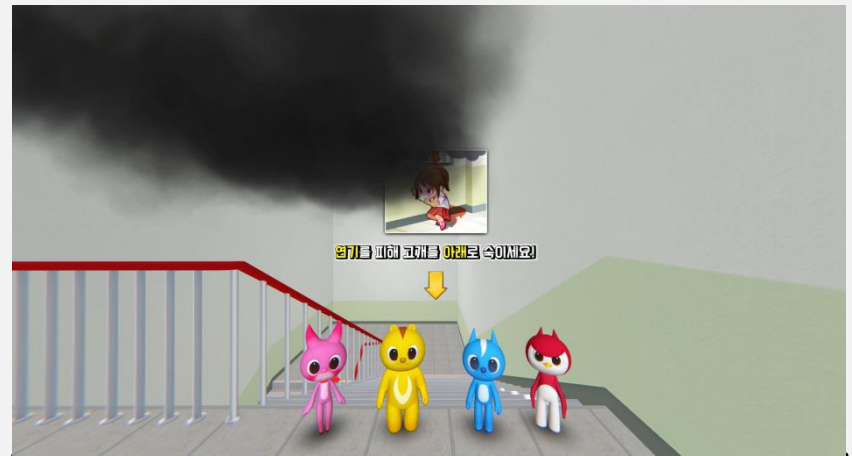
고개 숙이기 이미지