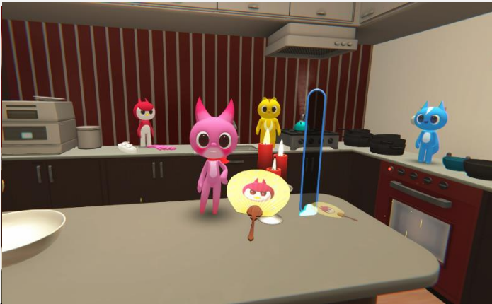
부채 흔들기 플레이 이미지