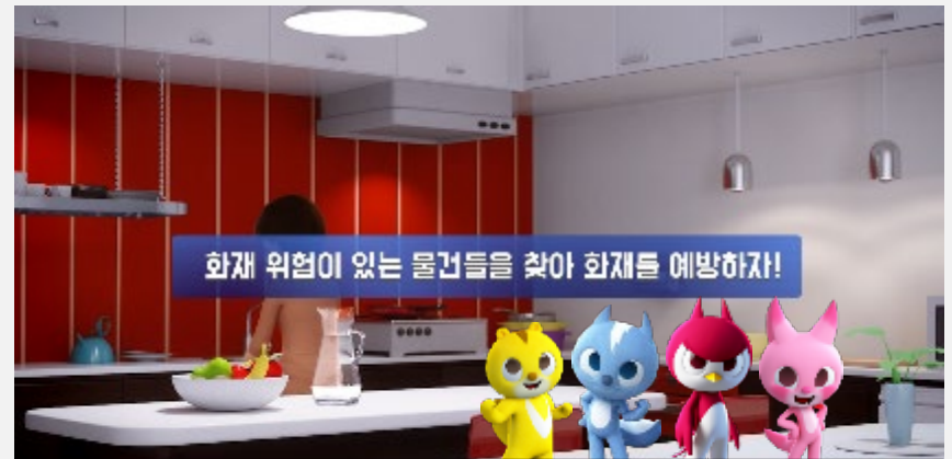
화재예방 플레이 이미지